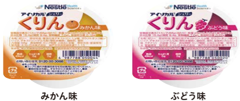
みかん味 ぶどう味