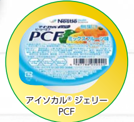
アイソカル® ジェリー PCF