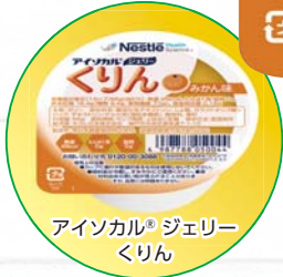
アイソカル® ジェリー くりん