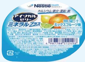
ミックスフルーツ味