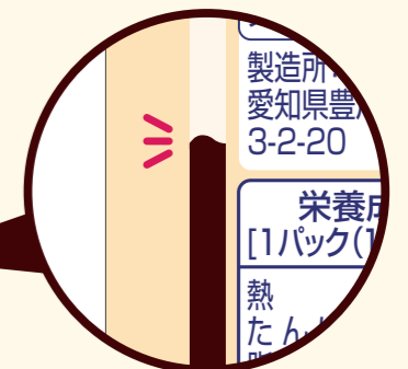
裏面で残量がわかる!