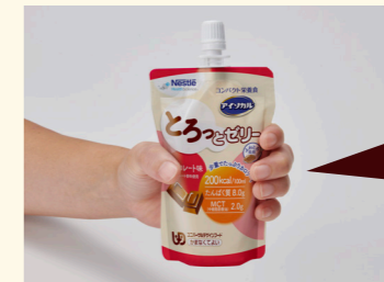
握りやすく持ちやすい設計